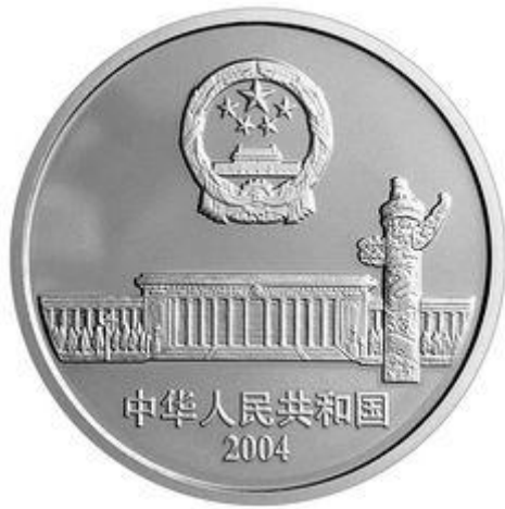
1 盎司圆形幻彩银质纪念币背面图案